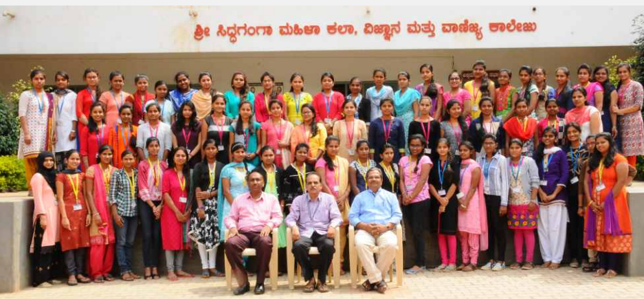
Group of Class Representatives